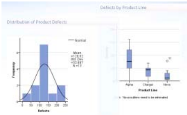
ตารางที่ 2 สถิติและเพิ่ม Cognos Statistics เข้าในรายงาน